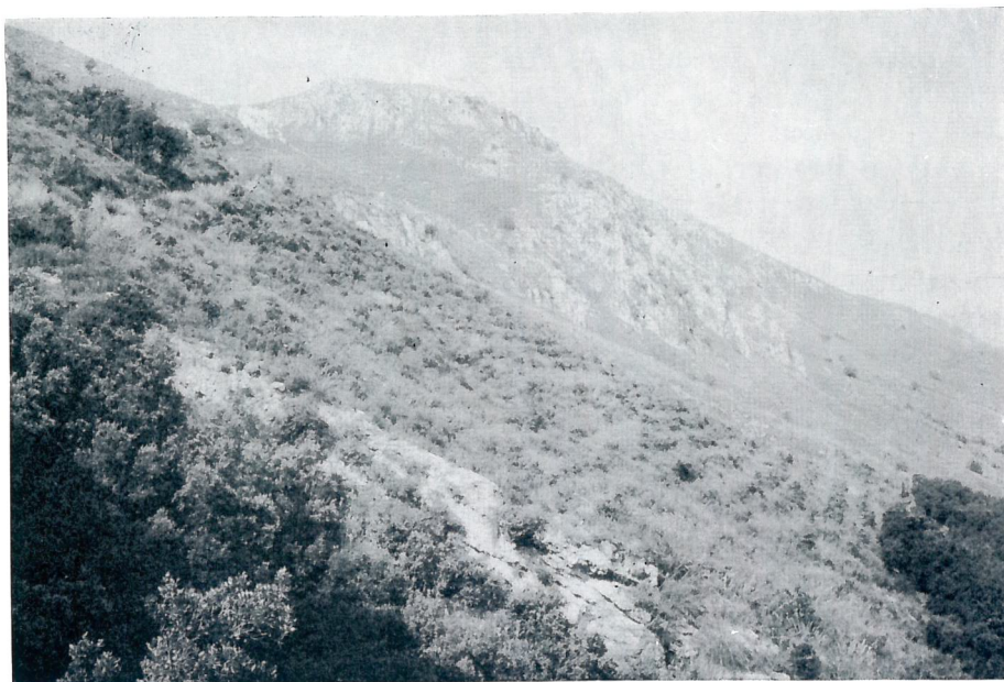
Fig. 2 — Versante N di Monte San Calogero: localizzazione della nuova stazione di Senecio inaequidens DC.

che S. inaequidens presenta nella stazione del Monte S. Calogero (cfr. fig. 1b), appare attendibile che la specie vada incontro a una larga diffusione sia in Sicilia che in Italia meridionale, con rapidità confrontabile, se non maggiore, a quella rilevata a Nord.